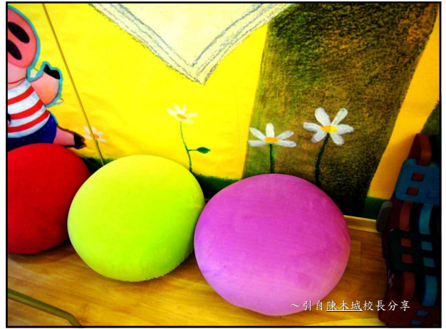
~引自陳木城校長分享