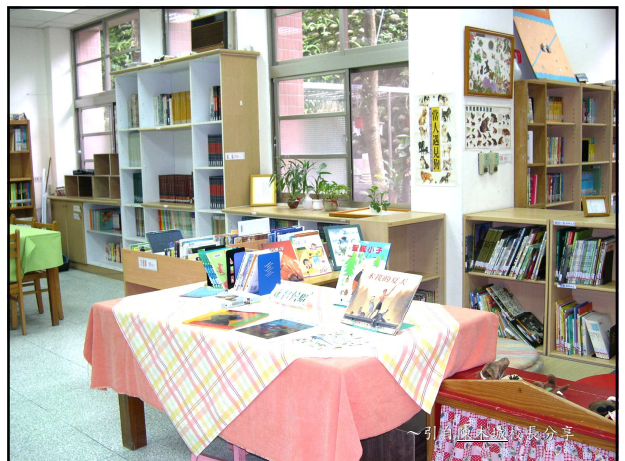
~引自陳木城校長分享