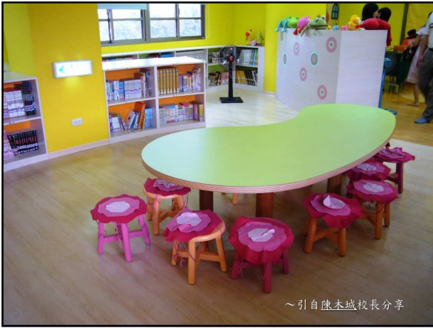
~引自陳木城校長分享