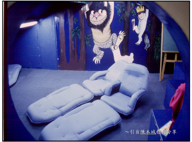
~引自陳木城校長分享