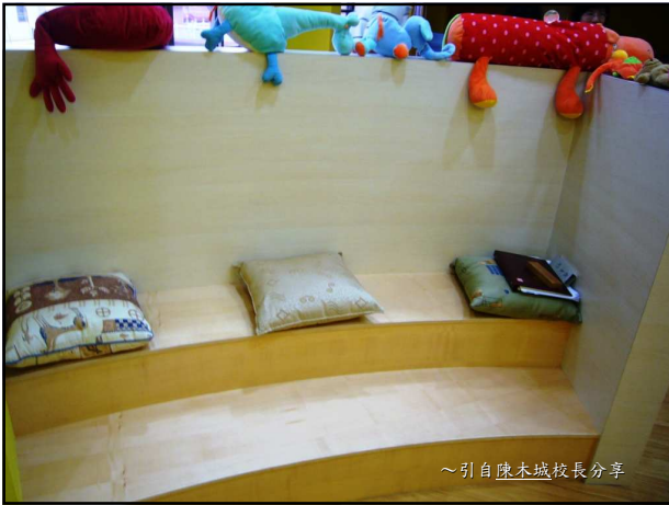
~引自陳木城校長分享