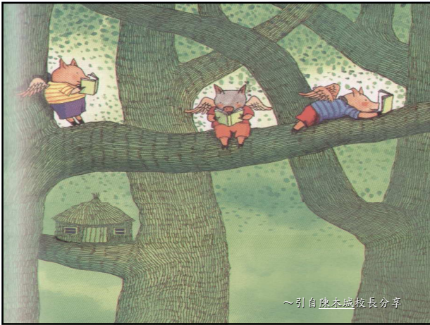
~引自陳木城校長分享