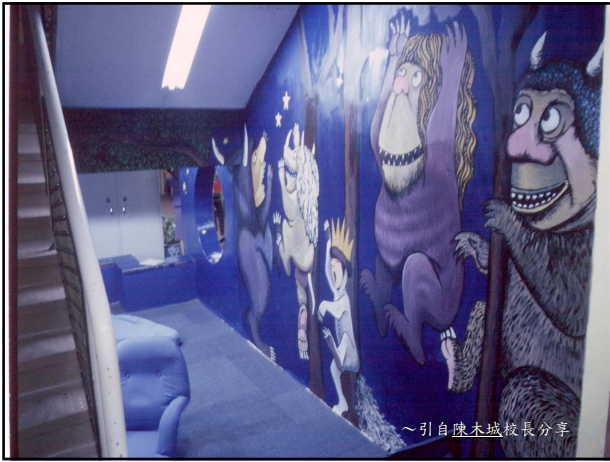
~引自陳木城校長分享