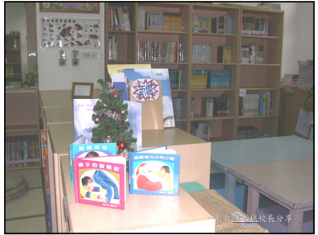
~引自陳木城校長分享