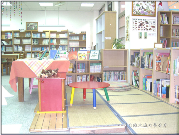
~引自陳木城校長分享