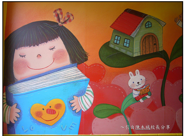
~引自陳木城校長分享