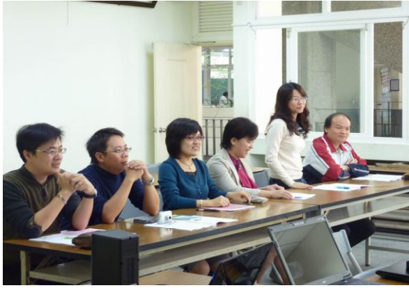
▲學員對性平議題與團員們互動熱烈