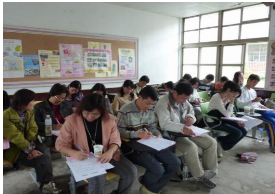
▲不分團員或學校教師均十分投入學習的氛圍