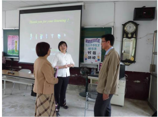
▲召集人蘇校長與副召集人沈校長與講師交流