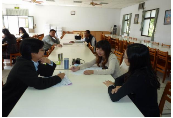
▲學員於活動中進行分組討論